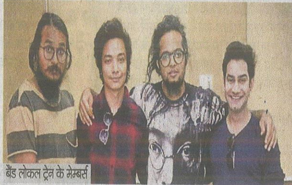
बैंड लोकल ट्रेन के मेम्बर्स

इंडियन इंस्टिट्यूट ऑफ टेक्नोलॉजी (आईआईटी) इंदौर का टेक्नो-कल्चरल फेस्ट 15 से 17 फरवरी को होने जा रहा है। देशभर के टेक्नीकल इंस्टिट्यूट के तकरीन 20 हजार स्टूडेंट्स इसमें होने वाली 100 से ज्यादा कॉम्पीटिशन में पार्टिसिपेट करेंगे। सबसे खास बात ये होगी कि इवेंट के जरिए प्लास्टिक को रीयूज करने की सीख दी जाएगी। शायर राहत इंदौरी, सिंगर अमित त्रिवेदी प्रोनाइट में अपने बैंड के साथ परफॉर्म करेंगे। लोकल